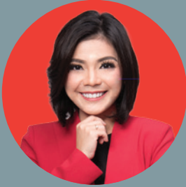
MERRY RIANA @merryriana